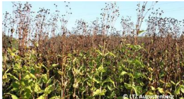
La silphie fin septembre, à partir de la 2e année