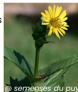
@ semenses du puy Fleur de silphie