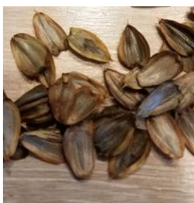
Graines de silphie

Elle peut être associée à du maïs précoce à demi-dose (idéalement à port dressé) en semant la silphie dans l'inter-rang du maïs pour limiter les adventices la 1ère année et sécuriser une demi-récolte.