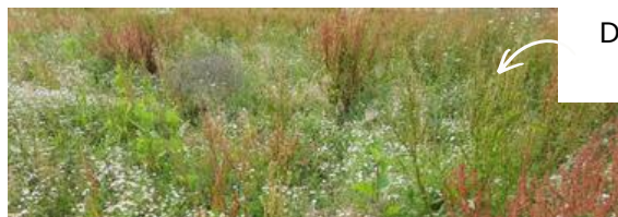
Deux situations contrastées