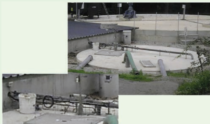
◀ Cuve de réception de lisier avec détecteur de niveau.