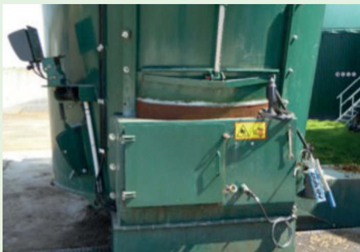
◀ Une trappe de visite sur la trémie d'incorporation.