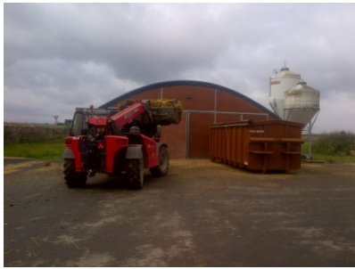
Chargement de caisson