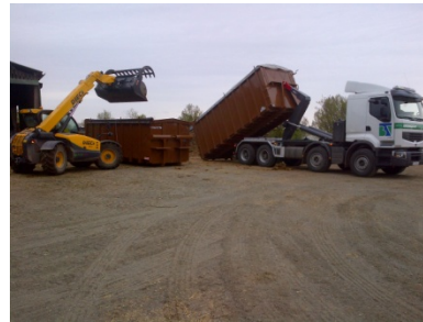
Rotation de caisson de fumier

Les digestats solide et liquide sont alors ramenés dans des stockages dédiés, avant épandage. Les agriculteurs adhérents n'ont pas à faire le transport entre leur ferme et le lieu d'épandage. Lors des curages, ils n'ont plus besoin d'utiliser leur remorque, ni de mobiliser une personne supplémentaire.